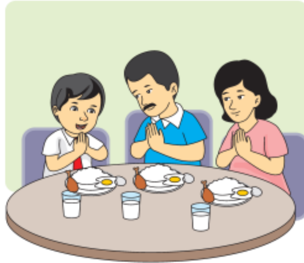
Gambar: 5.2