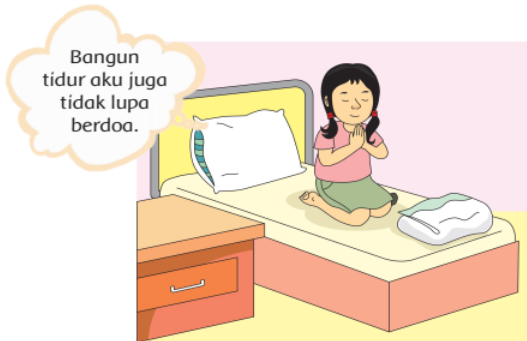
Gambar 5.7 Mengucapkan Doa Bangun Tidur