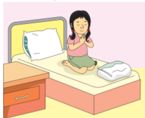
Gambar: 6.5 Doa Sebelum Tidur

Sebelum tidur, aku selalu berdoa dan bermeditasi.