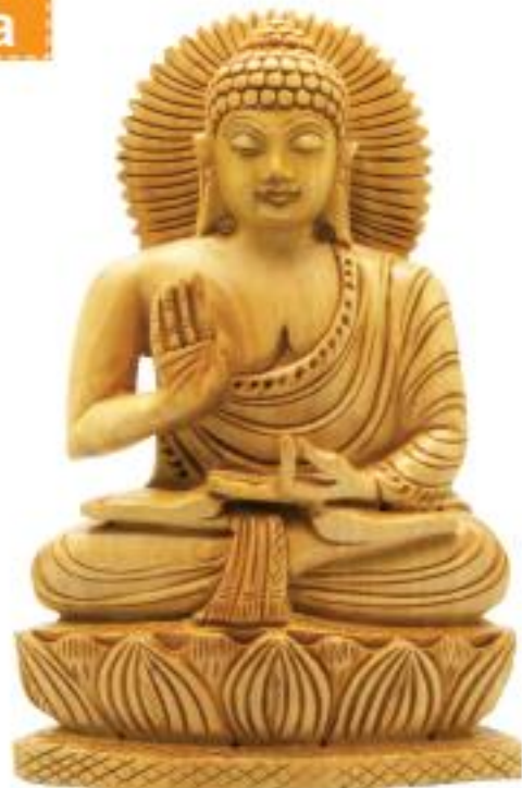
Gambar: 4.1 Buddha Gotama

Arca Buddha adalah lambang keluhuran. Arca Buddha sebagai lambang penghormatan. Buddha begitu luhur. Buddha sangat dihormati. Buddha telah mengajarkan Dharma. Buddha guru dewa dan manusia.