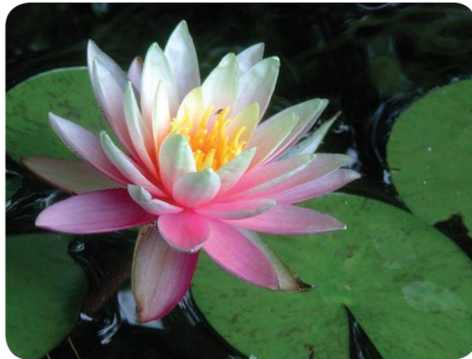
Gambar: 4.4 Bunga Teratai

Bunga teratai lambang kesucian. Bunga teratai tumbuh di lumpur yang kotor. Namun, tidak ternoda lumpur dan tetap bersih. Bunga teratai indah warnanya. Harum baunya.