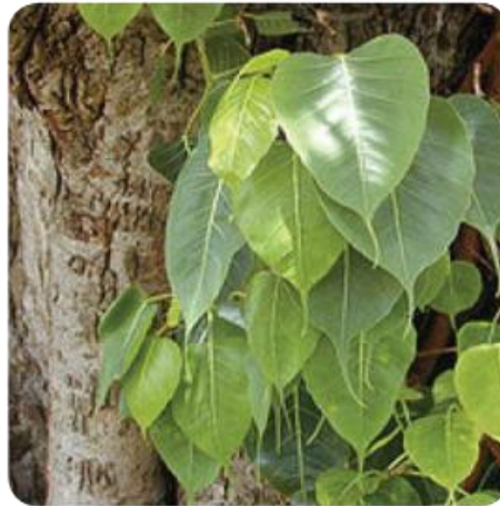
Gambar: 4.5 Pohon Bodhi