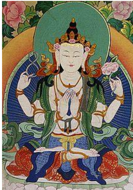
Bodhisattva Avalokiteshvara (Dewi Kwam Im)

Seorang bodhisattva memiliki tekad penuh kasih guna membantu seluruh makhluk untuk menuju pencerahan/kesadaran