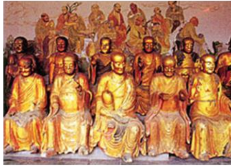
Gambar 3.5. Delapan belas Arahata