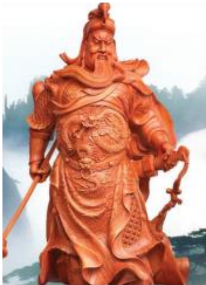
Gambar: 3.11 Para Dewa Belajar kepada Buddha

Gambar: 3.12 Dewa Kwan Kong