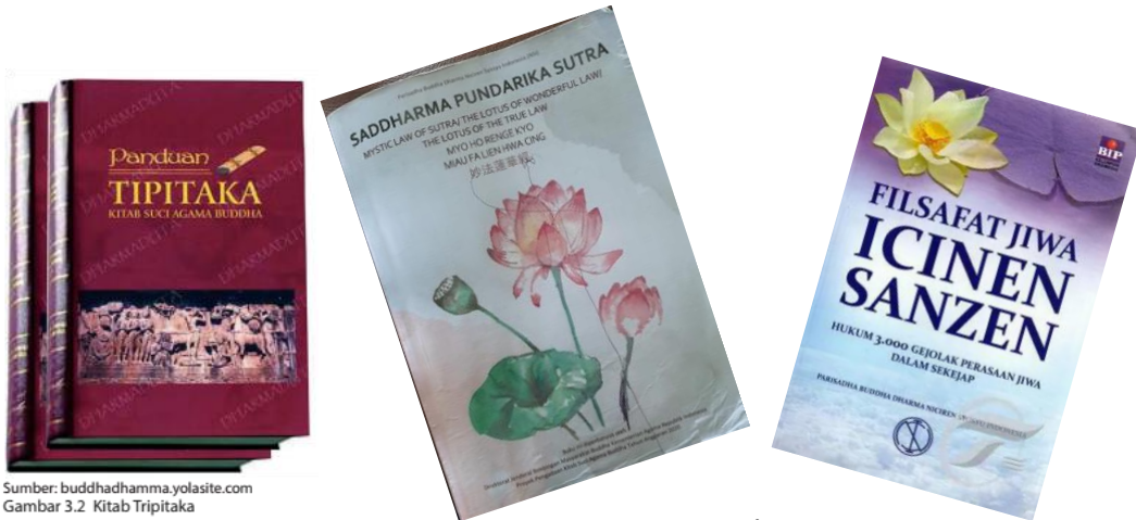
Gambar 3.2. Kitab Tripitaka

https://wordpress.com/posts/jepris.wordpress.com