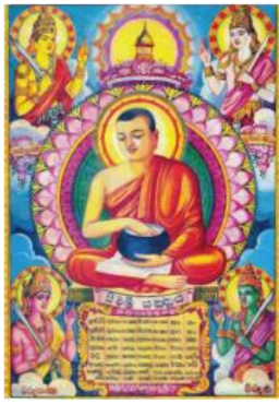
Gambar 3.4. Arahata Sivali